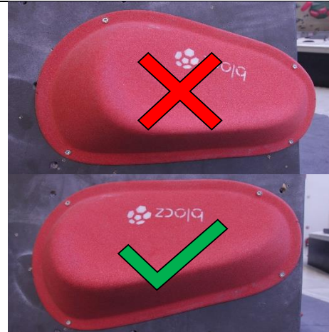
Bild 3 Befestigung an der Wand