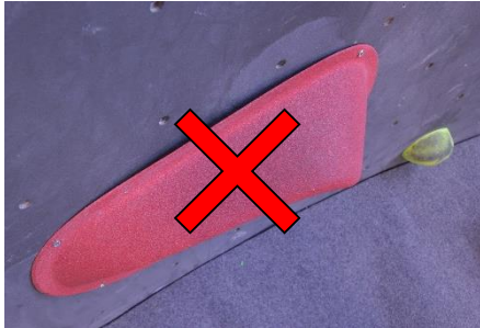
Bild 4 Unzulässige Befestigung an einer konkaven Wand