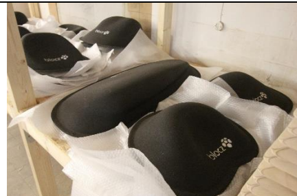
Bild 1 Macrostapel mit Zwischenschicht